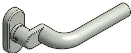
14.2576. / 14.5713.